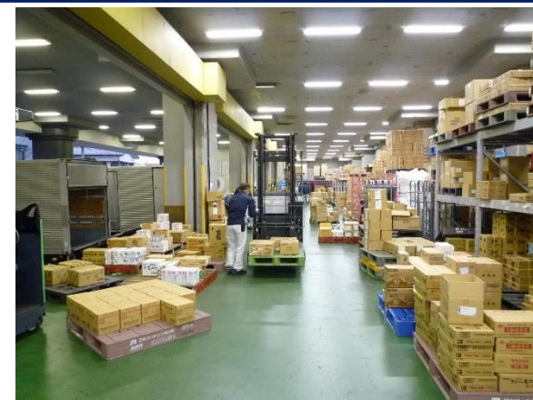
蛍光灯型LED照明を導入した倉庫内