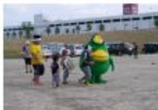
写真は第2回（平成26年9月）開催時のもの