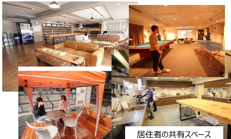
居住者の共有スペース

株式会社オークハウスが運営するシェアハウスに係るCO2排出をオフセットする。シェアハウスの電気使用と水道使用から排出されるCO2一年分を、J-VERおよびCERを無効化することにより、カーボン・オフセットする。主催者は、節電や節水、共有スペース（ラウンジ、キッチン等）の集中的利用を呼びかけている。