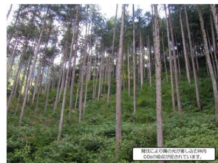
山梨県県有林のJ-VER等