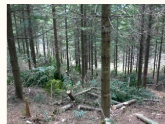
間伐され明るく健全な森林へ