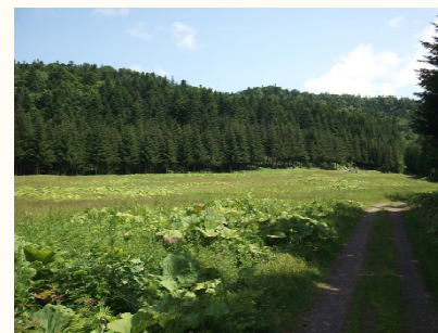
植樹・育林候補地