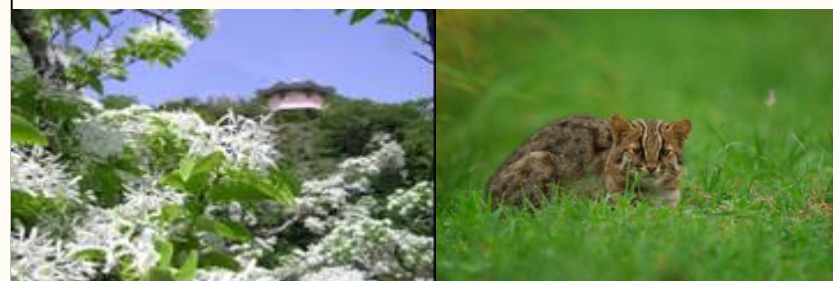
対馬の宝、ツシマヤマネコ（左上、右下） 絶景、対馬浅茅湾風景（右上） 韓国を望む展望台とヒトツバタゴ（左下）