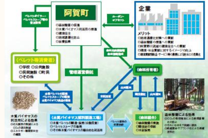
阿賀町バイオマスタウン構想