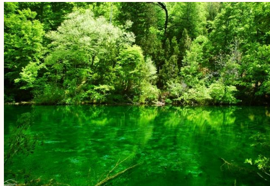
全国名水百選 「龍ヶ窪の水」