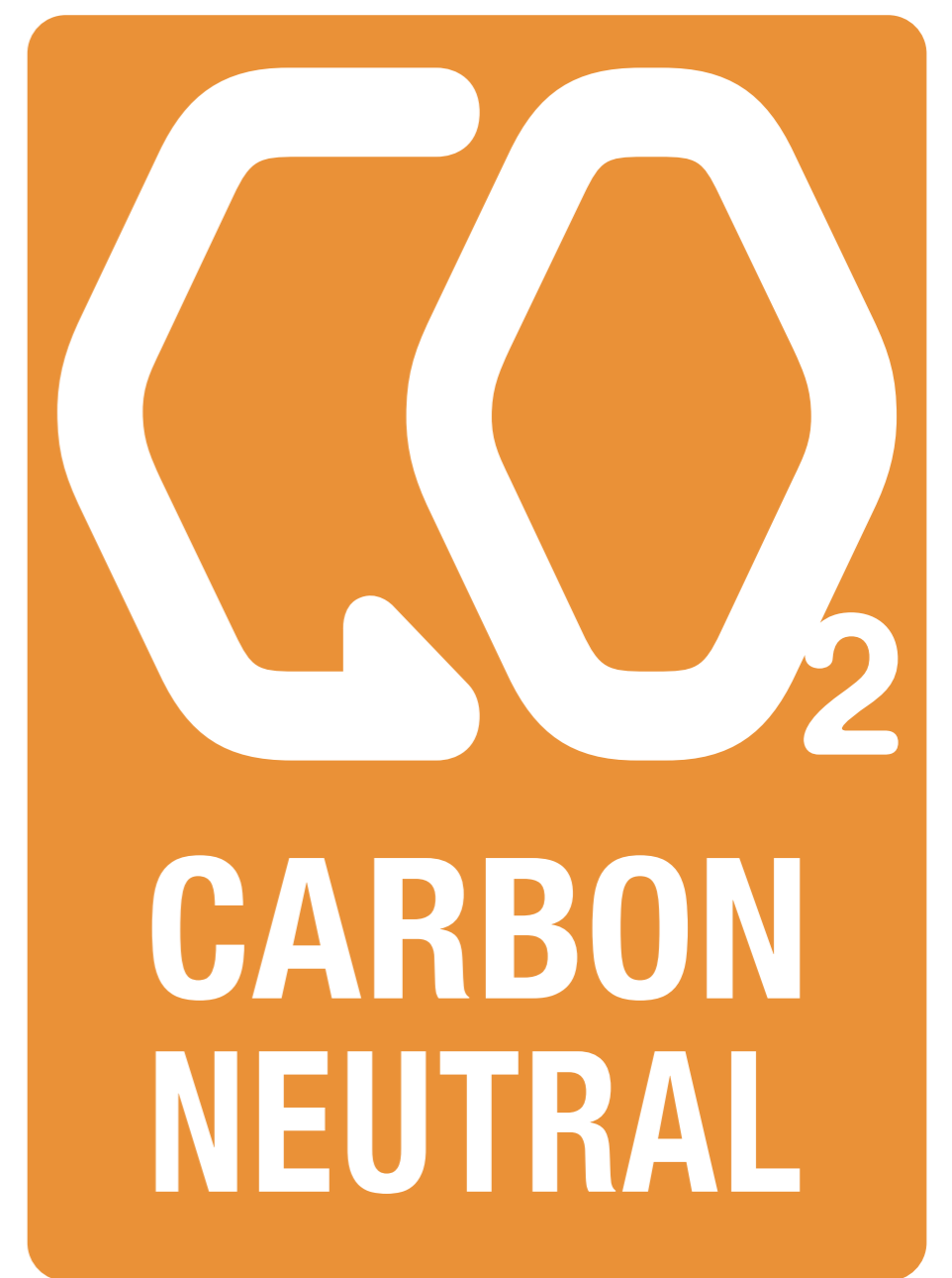
カーボン・ニュートラル 認証ラベル

クレジットの購入を通じて、地球温暖化対策だけでなく、地域貢献や森林保全、国際貢献、技術革新など様々な面から社会に貢献することができます。